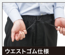
ウエストゴム仕様