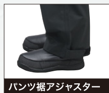
パンツ裾アジャスター