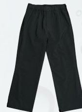
ストロングブラック